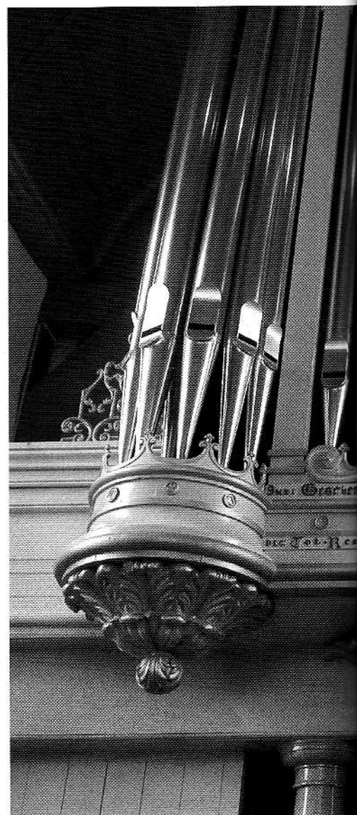
De schenker wordt vermeld op de lijst onder het orgel.

De eerste 108 jaar van haar bestaan heeft het instrument aan de oostkant van de kerkruimte gestaan, boven op een afsluiting van het koor. Deze afsluiting hield overigens ook het halfmanshoge Noormannenpoortje uit het zicht, een nog uit de roomse tijd stammende alternatieve vluchtroute naar het kerkhof. Deze diende offici-